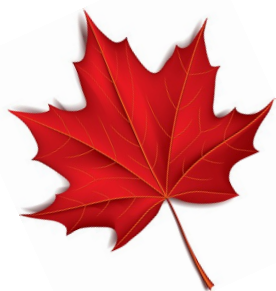
Tableau feuille d'érable