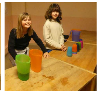
Accueil sympathique au bar..