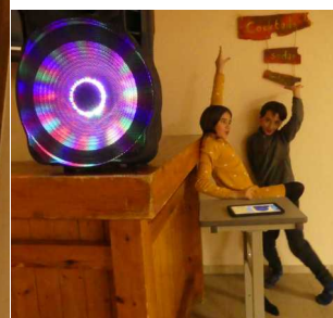
Les D.J. et leur play-list ont mis le feu sur la piste..