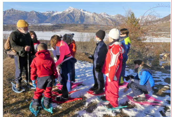
Vue sur le plateau d'Ancele, un des plateaux les plus élevés de France. C'est un ancien lac glaciaire.