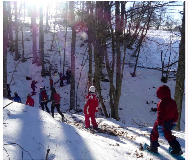
A la recherche d'empreintes d'animaux sauvages..

Paul à l'ouvrage... Même les sciences de la Nature sont prétextes à raconter de belles histoires.