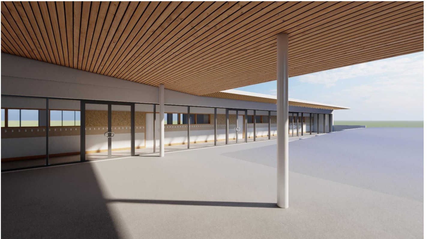
Vue depuis le nouveau préau de la cour élémentaire (actuellement cour enherbée)