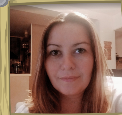
Responsable communication digitale