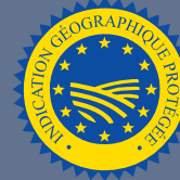
LES PRODUITS BÉNÉFICIAINT D'UNE INDICATION GÉOGRAPHIQUE (IGP)