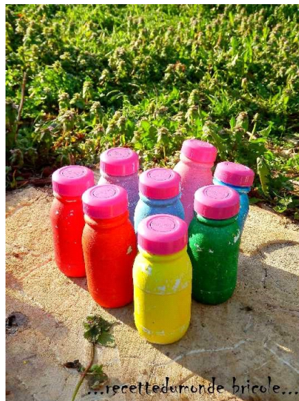
Les bouteilles sensorielles

C'est simple, ludique, éducatif et cela plaît aux tout-petits et même au plus grands ! Pour plus de sécurité, coller le bouchon.