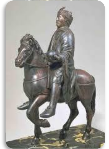
Doc 3 : Statue de Charlemagne, au musée du Louvre.