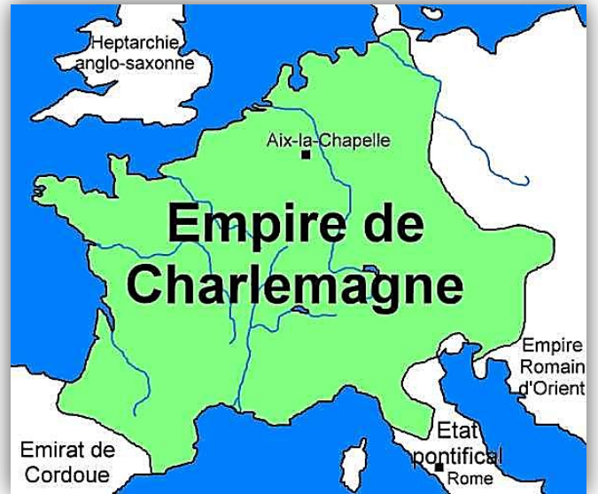
Doc 1 : L'empire de Charlemagne en 814

❻ Doc 3 : Où peut-on voir cette statue ? _____