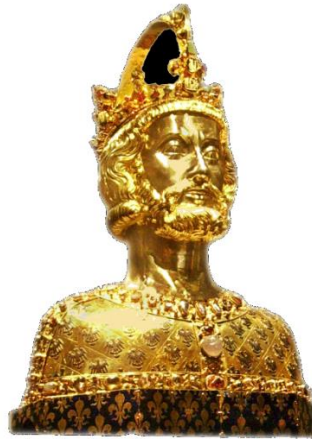
Doc 2 : Le buste de Charlemagne, trésor de la cathédrale d'Aix-la-Chapelle fait après 1349.