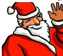
le Père Noël